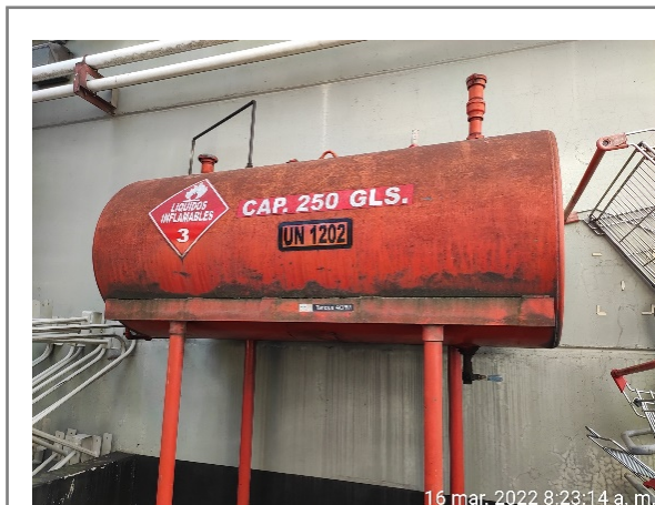
Fotografía 3. Nomenclatura del predio