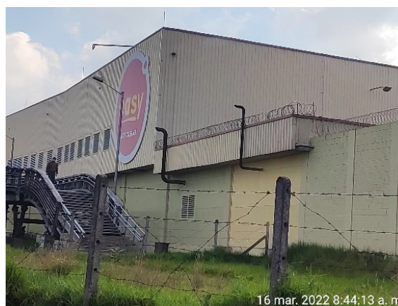
Fotografía 4. Ductos planta eléctrica y tanque ACPM